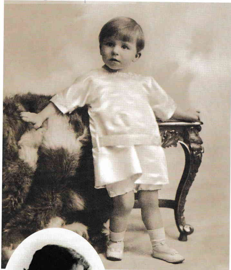
6. Principele Mircea al României, la vârsta de 3 ani