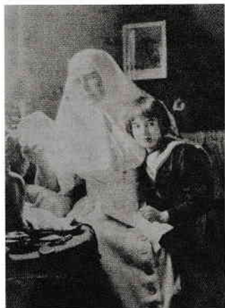
2. Regina Maria și Principesa Ileana în trenul regal, la Ciurea, noiembrie 1916