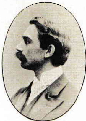
8. Prințul Barbu Știrbei