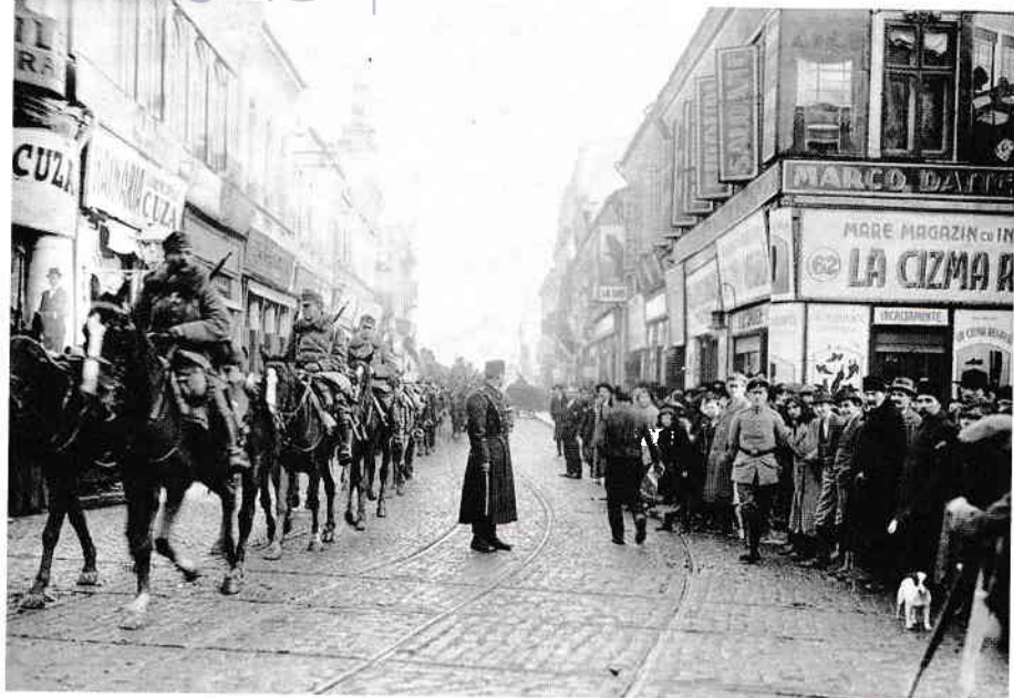
1. Cavaleria inamică ocupând Bucureștiul, 6 decembrie 1916