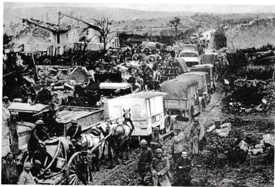
5. Coloană de refugiați și militari, toamna anului 1916