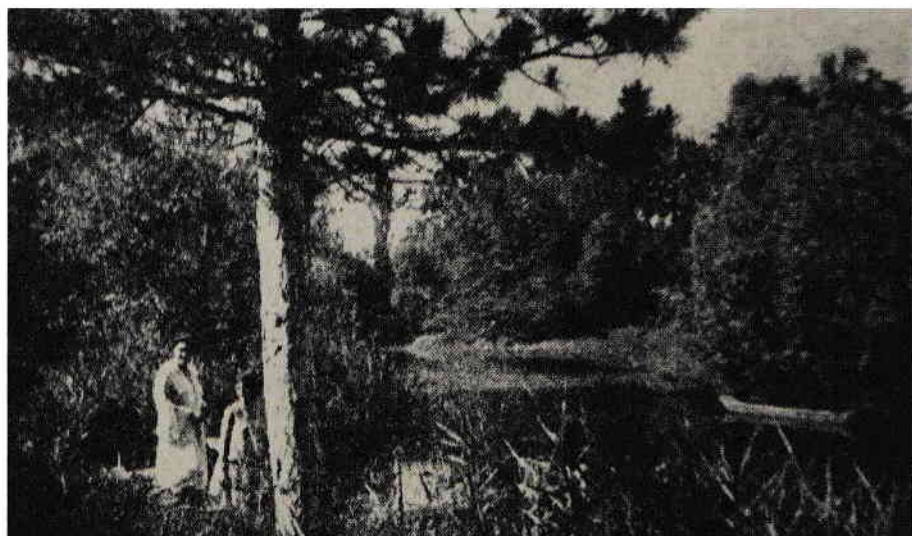
9. Parcul domeniului de la Copăceni