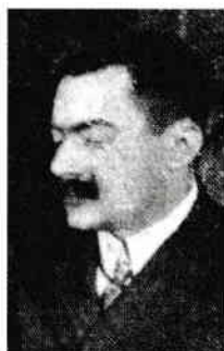
10. Mihai Cantacuzino, politician și primar al Bucureștiului, soțul Marucăi